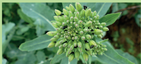
Meligèthes sur colza