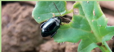
Altise sur colza