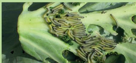
Chenilles de piérides sur chou