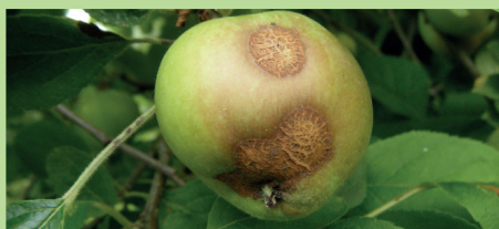
Tavelure sur pomme