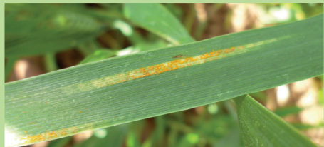
Rouille jaune sur blé