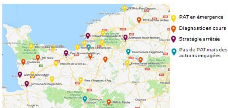
Panorama des PAT de Normandie : 27 démarches en cours

Démarches retenues AAP national : Communauté d'agglomération du Havre (2017), Métropole de Rouen (2018), Pôle métropolitain Caen (2019) Démarches soutenues AAP Région 2019 (réalisation de diagnostic) : St Lo Agglo, Coutances Mer et Bocage, Lisieux Agglo, Seine Normandie Agglo, Bernay Intercom, Parc du Perche