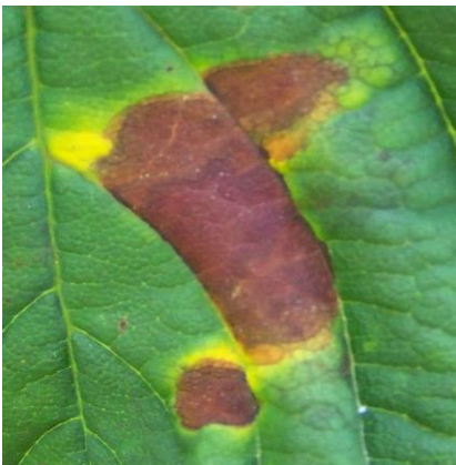
Black rot du marronnier

Les premiers dégâts sont enregistrés dès le mois de juillet. L'intensité de la maladie a été peu importante en 2014.