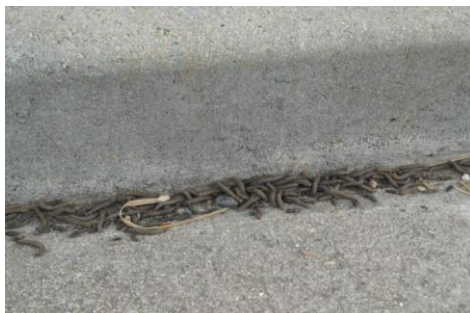
Larves de tipule tombées dans un caniveau

De nombreuses observations de collectivités ont été recensées en mars et avril, concernant des phénomènes spectaculaires de présence en grand nombre de larves de tipules, au niveau des caniveaux, allées, gazons, ... . Dans une telle situation, ces larves occasionnent des impacts esthétiques. Aucun dégât sérieux aux pelouses n'a été signalé.