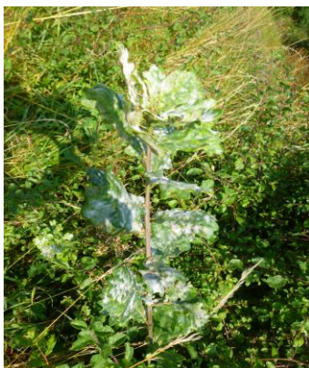
Oïdium sur chêne

Cette maladie a été observée d'avril à la fin de l'été. Les végétaux les plus marqués en 2014 par l'oïdium sont : rosier, berbérís et chêne. A chaque observation, les conséquences sur les plantes étaient faibles.