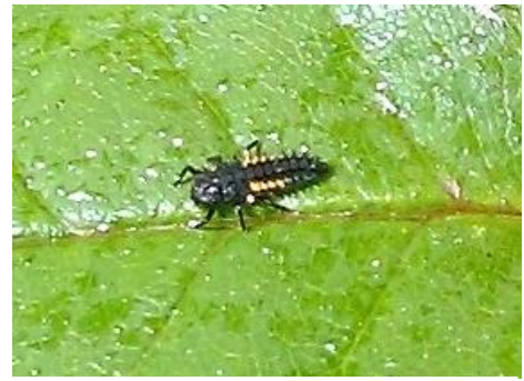
Larve de coccinelle sur feuille de rosier

La période estivale se résume par une très bonne activité des auxiliaires (coccinelles, syrphes, cécidomyies, micro-hyménoptères).