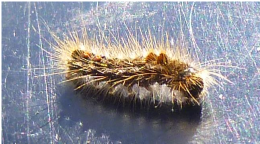
Chenille de bombyx cul brun

La présence de bombyx cul brun a été importante voire envahissante selon les zones. Les observations se sont faites tout le début de l'année allant de janvier avec la présence des nids jusqu'à fin mai. Ces chenilles urticantes pour l'homme et les animaux ont été retrouvées sur un grand panel de végétaux : prunus, chênes, argousiers, ronciers, ... .