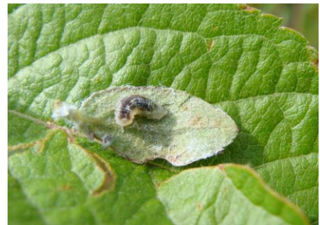
Larve de syrphes