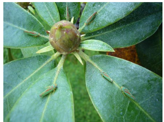
Cicadelles du rhododendron

La cicadelle du rhododendron a été retrouvée en espace vert en juillet. La cicadelle est responsable de la maladie des boutons noirs ( Blud Blast ) qui fait avorter les boutons floraux avant la floraison. Cette pathologie est courante et peut faire de d'importants dégâts localement.