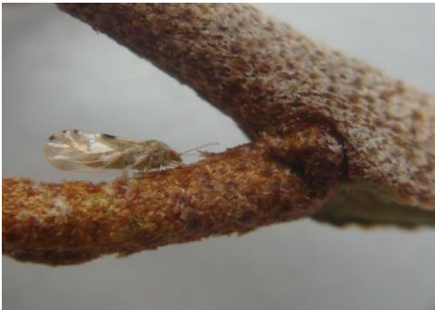
Adulte de Cacopsylla fulguralis (psylle éléagnus) à la loupe binoculaire

Courant avril, dans le Calvados, des larves de psylles ont provoqués quelques nuisances esthétiques sur buis et éléagnus. Ces larves sécrètent du miellat qui part la suite va se recouvrir de fumagine, altérant ainsi l'aspect des végétaux et pouvant réduire la croissance par perte d'assimilation chlorophyllienne.