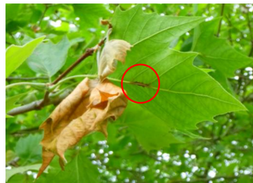
Anthraxose sur platane

Le champignon à l'origine de la maladie de l'anthraxose du platane est favorisé par un printemps frais et humide. C'est au mois de mai que les observateurs ont constaté la présence de la maladie mais avec une intensité très faible donc sans risque de défoliation précoce des arbres.