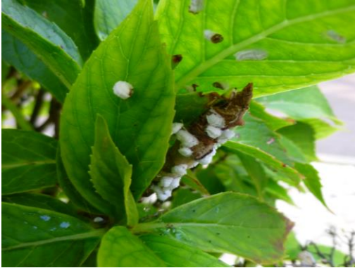
Cochenilles pulvinaire sur hortensia

Et, en fin d'année, c'est une attaque de cochenille farineuse qui a eu lieu sur Phormium Tenax dans le Calvados.