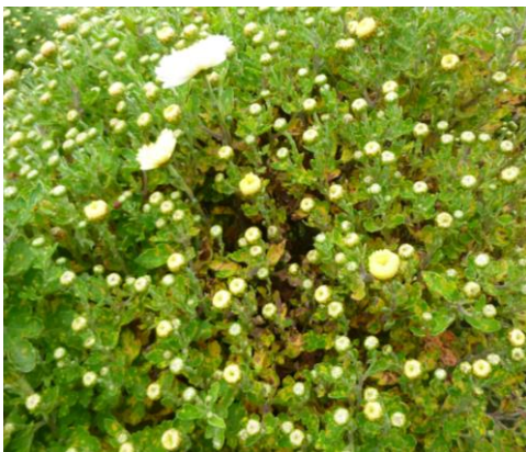
Puccinia horiana sur chrysanthème

En ce qui concerne la rouille blanche du chrysanthème, quelques attaques sont relevées dans des collectivités sur des variétés sensibles avec pour conséquence des dégradations de feuillage. Dans l'ensemble, la pression rouille blanche en 2014 a été faible.