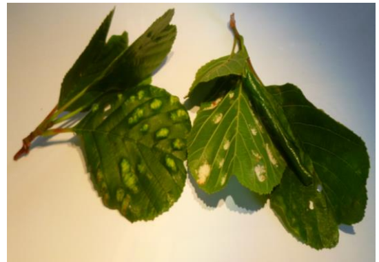
Dégâts de phytope de l'aulne

Des attaques abondantes de phytope (sur érable et aulne) sont notées courant juin. Néanmoins, ces attaques n'ont eu aucune conséquence sur les végétaux.