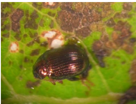
Altise du peuplier

Quelques rares cas de dégâts de morsures d'altise sur peuplier et sur fuchsia ont été identifiés dans le Calvados et la Manche pendant la période estivale.