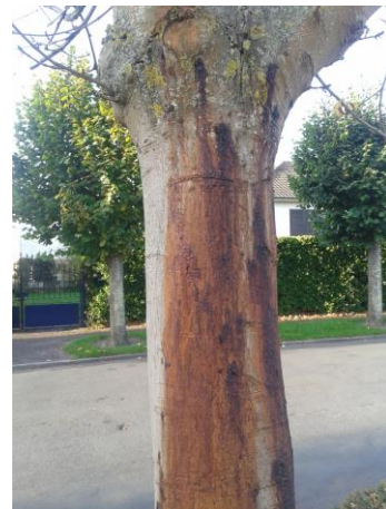
Chancre bactérien du marronnier

Des cas avérés de chancre bactérien du marronnier ( Pseudomonas syringae ) ont été identifiés dans le Calvados en fin d'année. C'est une pathologie bien installée dans la région dont les cas progressent tous les ans.