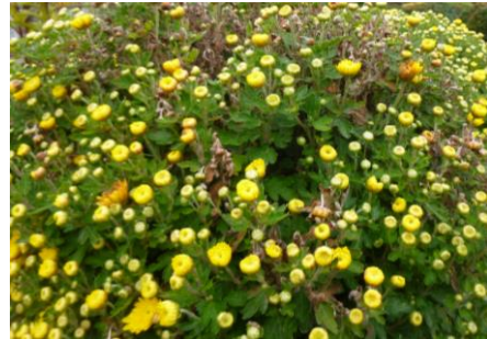
Botrytis cinerea sur chrysanthème

Toujours sur chrysanthème, quelques cas de pourriture grise ont été identifiés en octobre. Là-aussi, la pression fongique était faible.