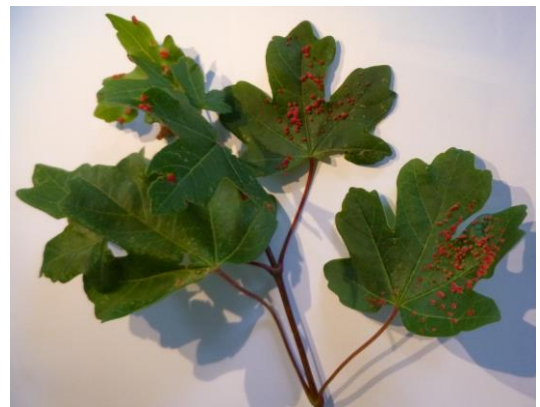
Dégâts de phytope de l'érable